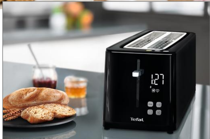
SMART'N LIGHT BROODROOSTER MET 2 LANGE GLEUVEN TL640 TL640810